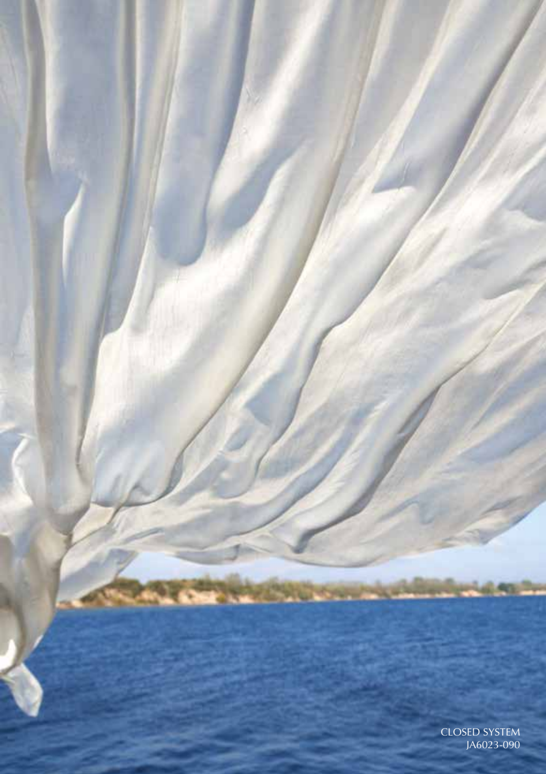
CLOSED SYSTEM JA6023-090