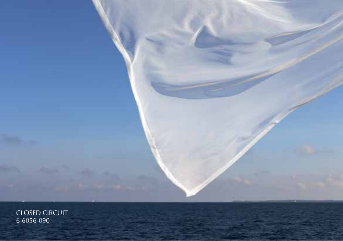
CLOSED CIRCUIT 6-6056-090