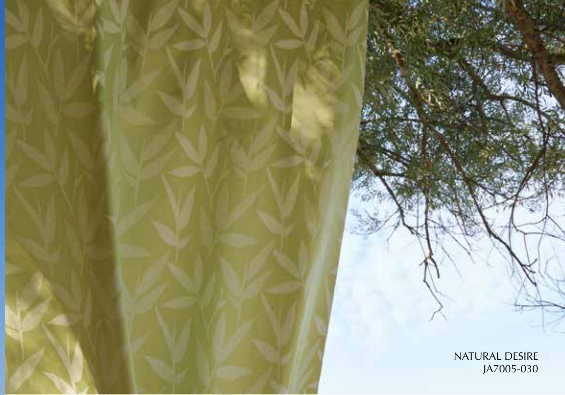
NATURAL DESIRE JA7005-030