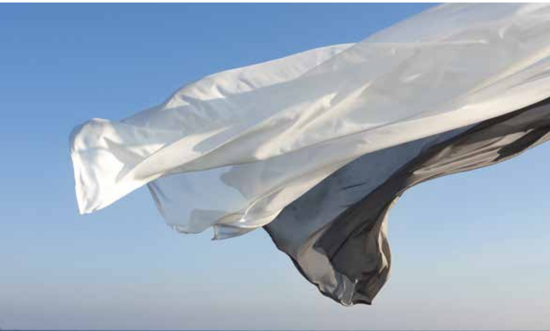
CLOSED CYCLE 9-6053-092, -070